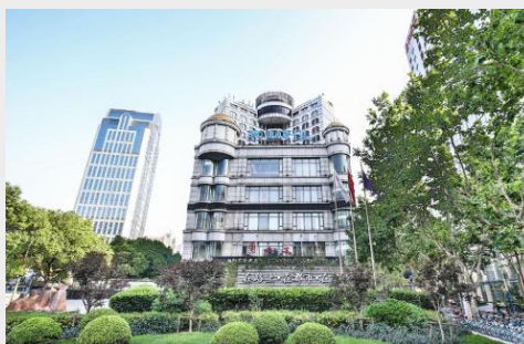
SSAW BOUTIQUE HOTEL HONGKOU 4*