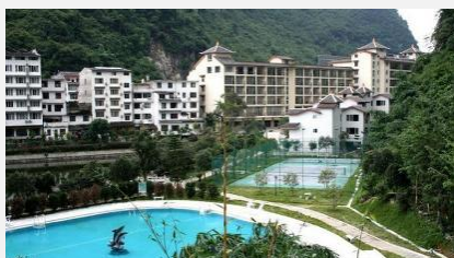
YANGSHUO NEW WEST STREET 4*