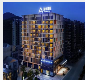
GUILIN GAOXIN ATOUR HOTEL 4*