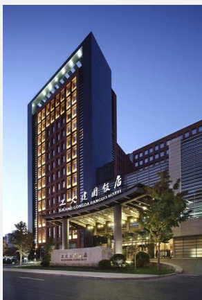
GONGDA JIANGUO HOTEL 4*