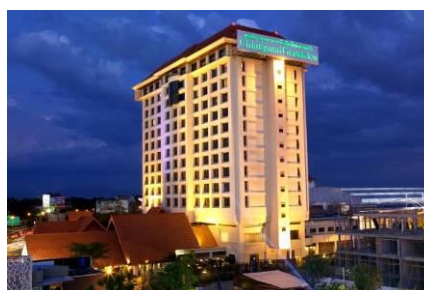
GRAND VIEW HOTEL