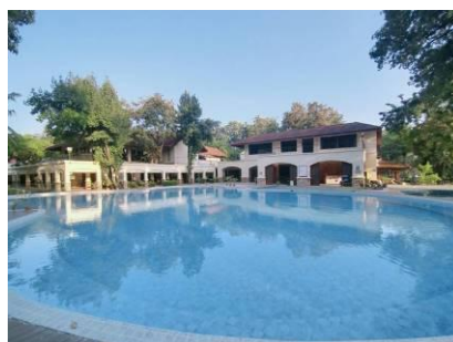
PUNG WAAN RESORT & SPA