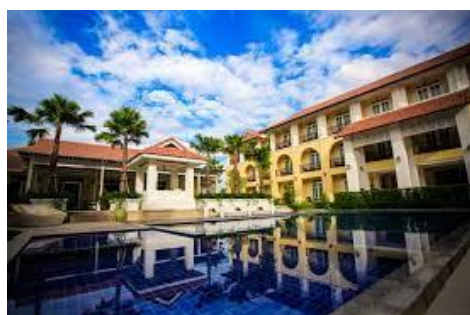
KHAM THANA HOTEL